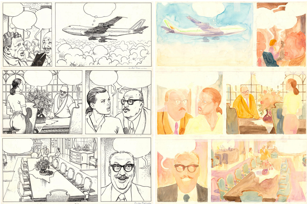
Milo MANARA - Le Déclit - Une femme sous influence - Tome 1 - Planche 3 - 1984 - Encre de Chine sur papier 61 x 45,7 cm

Du 30 avril au 31 mai 2025 prochain, Huberty & Breyne accueille une rétrospective de planches originales de Milo Manara. Cette exposition, hommage à l'un des maîtres de la bande dessinée européenne, dévoile l'exceptionnelle richesse de son œuvre marquée par la sensualité, la poésie et la maestria du dessin. Dans ses planches extraites du Singe , des Aventure de Giuseppe Bergman , du Déclit , du Parfum de l'invisible , de L'été indien ou encore des Borgia , les visiteurs pourront explorer l'évolution artistique d'un créateur qui a su imposer son style inimitable à travers des décennies de création.