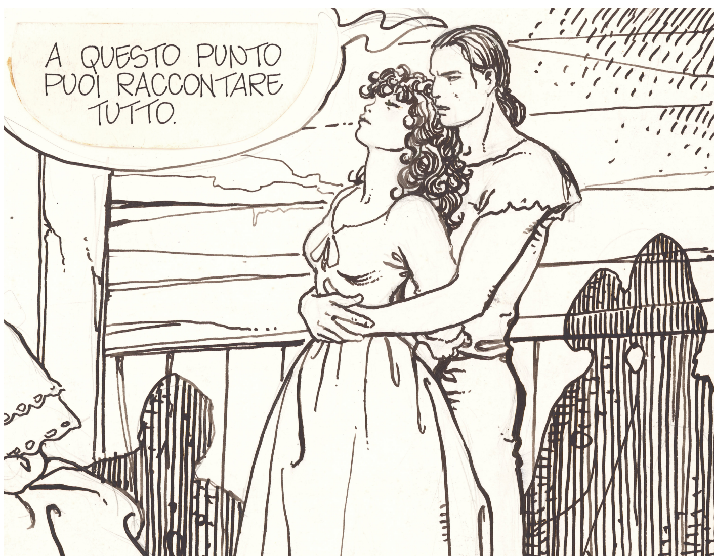
Milo MANARA - Un été indien (Détail) - Planche 90 - 1987 - Encre de Chine sur papier - 60,7 x 45,8 cm