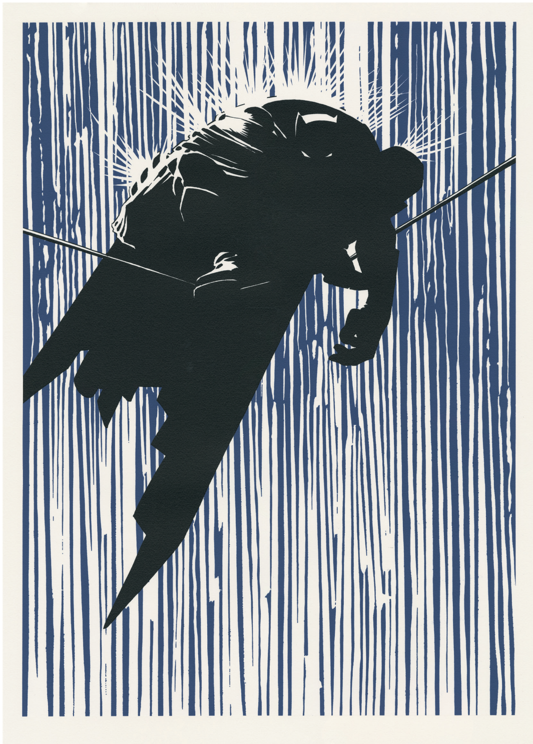
Frank MILLER - Batman - Dark Knight - 2024 - Sérigraphie en 3 couleurs sur papier - Édition à 150 exemplaires 70 x 50 cm - Signée et numérotée par l'artiste - Réalisée sur les presses de l'atelier Tchikebe à Marseille