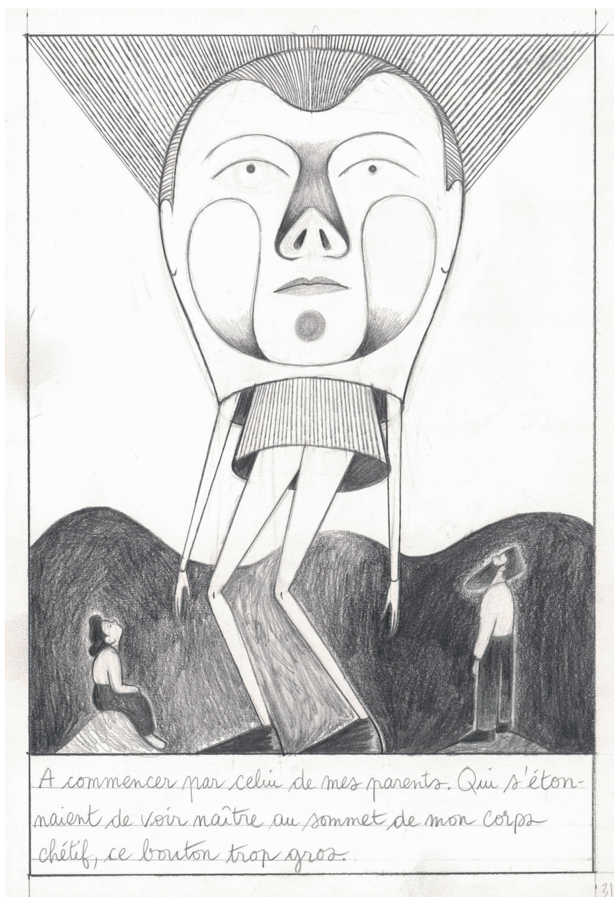
Et c'est ainsi que je suis née - 2025 - Planche 31 - Crayon noir sur papier - 27,6 x 18,7 cm

Illustratrice, autrice de bande dessinée, dessinatrice pour la jeunesse et la presse, chanteuse et musicienne, Fanny Michaëlis est une artiste polymorphe dont le travail se déploie dans un constant aller-retour entre le réel et l'imaginaire, l'actualité et la poésie, le dessin et les mots. Dans Et c'est ainsi que je suis née , sa dernière bande dessinée (éditions Casterman), le dessin déborde la case, explore les marges, car Fanny Michaëlis conçoit la bande dessinée comme un véritable langage. Elle écrit par les images, dessine les mots et fait du médium un véritable champ d'expérimentations graphique et narratif. La galerie Huberty & Breyne, Paris | Chapon 21 est heureuse de présenter une sélection de planches originales à admirer du 24 janvier au 21 février 2026.