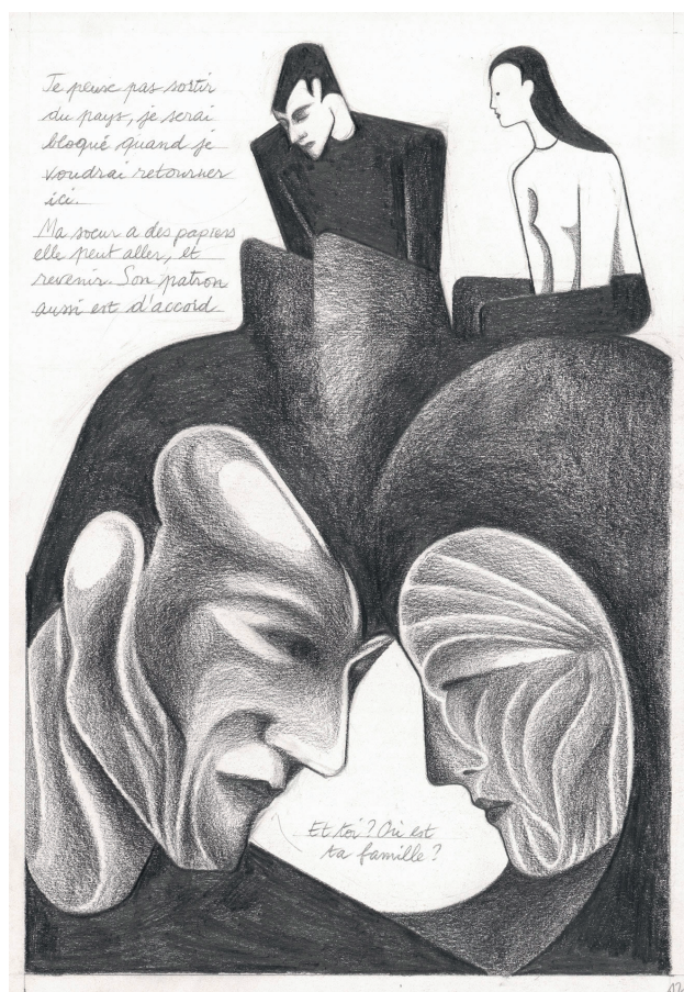
Et c'est ainsi que je suis née - 2025 - Planche 129 Crayon noir sur papier - 27,7 x 19,2 cm