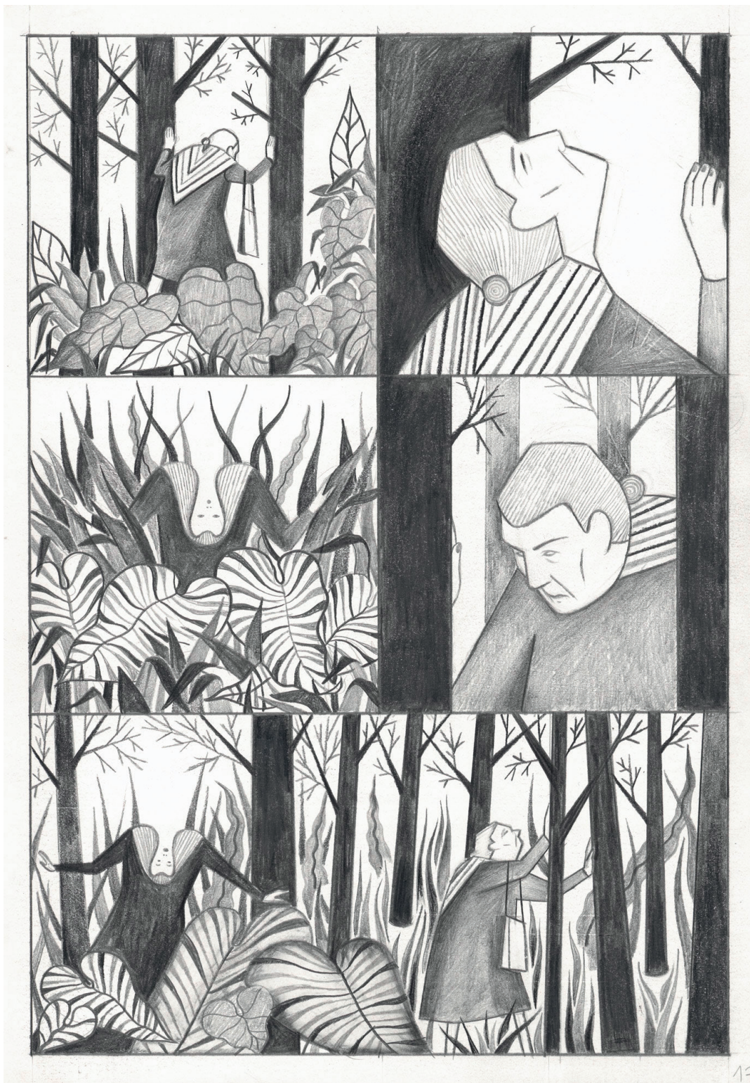
Et c'est ainsi que je suis née - 2025 - Planche 17 - Crayon noir sur papier - 27,7 x 19 cm