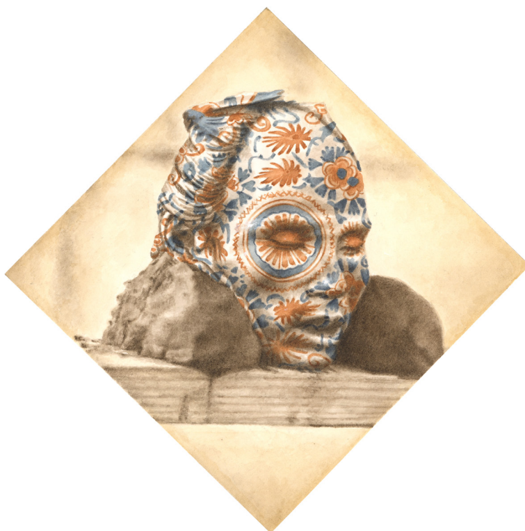
Milan Jaspers - Gôkumon - 2024 - Aquarelle sur papier - 14,6 x 14,6 cm - Signé au dos

Milan Jaspers élabore ses images dans un équilibre subtil entre révélation et restitution, partagé entre le regard d'un dessinateur et celui d'un peintre. Usant d'une palette à l'aquarelle fidèle aux teintes traditionnelles sépia des premières photographies, il intègre des motifs colorés qui évoquent chromatiquement notre modernité. Travail de précision et de patience, l'artisanat du pinceau répond à ce procédé révolutionnaire et rapide de la photographie qui sert ici de modèle, la peinture répondant à la nécessité contemporaine de « prendre le temps ».