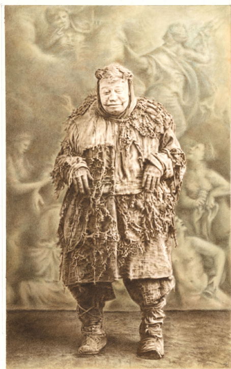
Milan Jaspers - The Pig - 2024 - Aquarelle sur papier - 42,3 x 26,3 cm - Signé en bas à droite

C'est contre cette maxime que s'est formée la seconde partie des travaux présentés lors de l'exposition, signant la fin d'une ère et dévoilant des chairs tourmentées et des silhouettes se dissimulant derrière de lourds tissus à l'ombre de palais de porcelaine. Figures liées à une décennie d'excès, de remords, de voyages cosmiques et trous noirs, de bile, d'angoisse et de honte. Dans Le Mariage du Ciel et de l'Enfer (1790), le poète visionnaire William Blake affirmait que « la route de l'excès mène au palais de la sagesse ». Bien que certains dessins n'entretiennent pas un lien direct et intime avec l'alcool, ils offrent une opportunité d'explorer, sans artifice, cette substance singulière et les perspectives qu'elle a engendrées à travers la création.