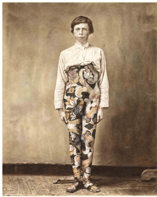
Milan Jaspers - Vergogna II - 2024 - Aquarelle sur papier 52 x 41,5 cm - Signé en bas à droite

Intitulée « Vergogna » (du latin : retenue, pudeur, honte), la première série se compose de quatre portraits en pied montrant des hommes à demi-nus dans un intérieur modeste.