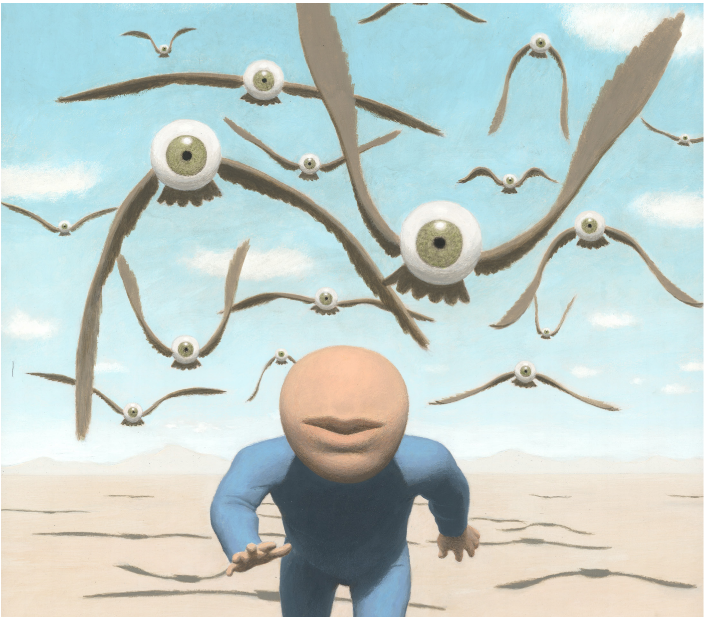
(Détail) Le fugitif - 2026 - Acrylique sur papier - 55 x 43 cm - Signé et daté au dos