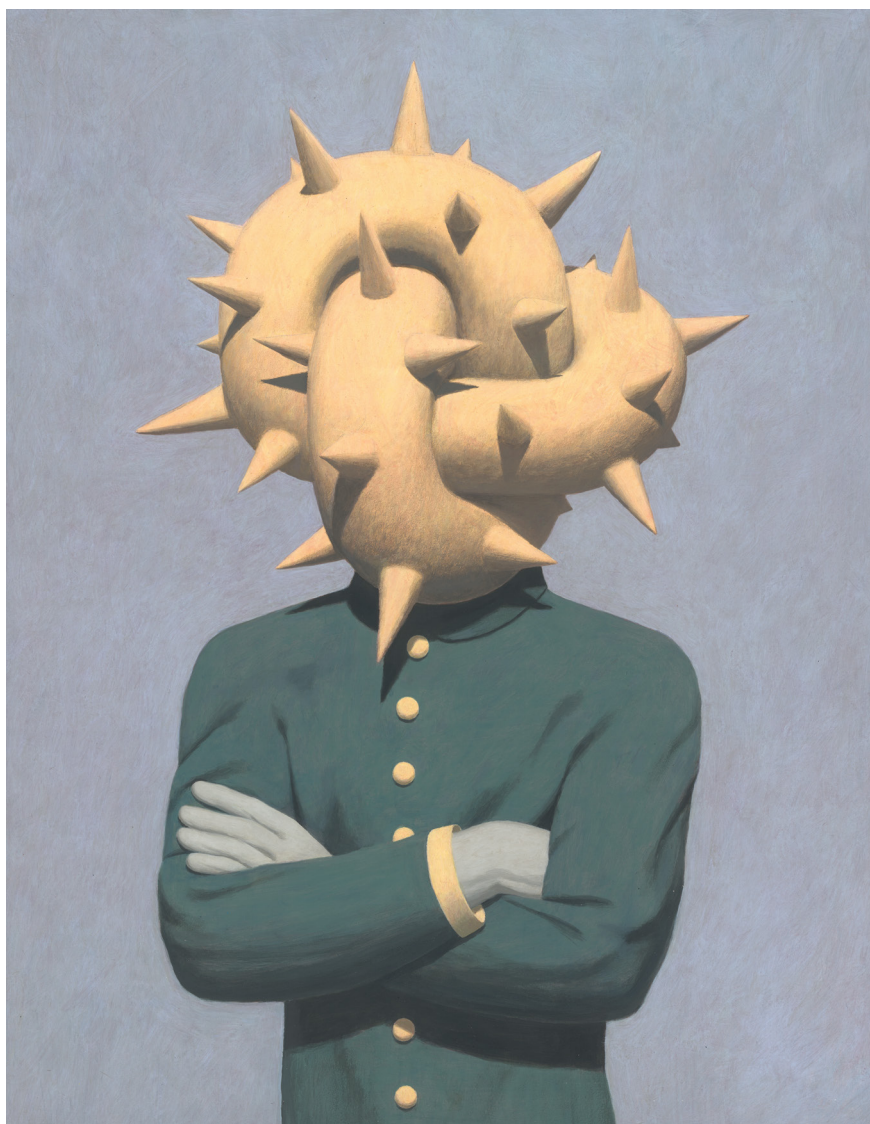
Colonel Noupique - Acrylique sur papier - 60 x 46,7 cm - Signé et daté au dos

Loin d'une peinture narrative ou illustrative, son travail engage avant tout une expérience du regard. Le spectateur est constamment renvoyé à la matérialité même de l'image : la lumière crue, les ombres nettes, les perspectives déstabilisées, les couleurs acidulées — parfois presque irréelles — composent des scènes dont le mystère réside moins dans ce qu'elles représentent que dans leur manière d'exister picturalement.