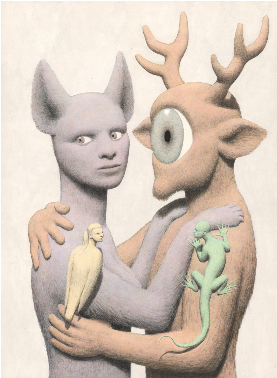
Actéon Variation - 2026 - Acrylique sur papier - 65 x 47,6 cm - Signé et daté au dos