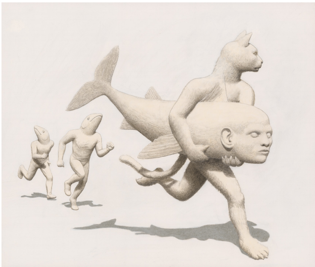
Pêche-poursuite - 2026 - Acrylique sur papier - 44,5 x 53,5 cm - Signé et daté au dos

Dans cet univers dense et silencieux, le spectateur, libre d'interpréter, est invité à voir.