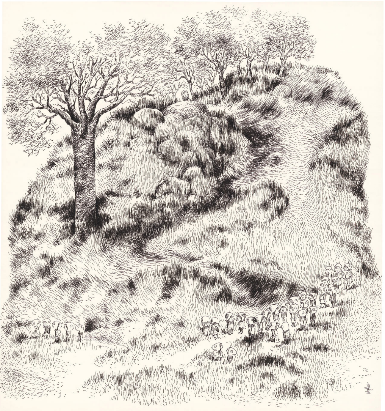
Encre de Chine sur papier - 25,6 x 24 cm

Pour son nouvel ouvrage, Les Julys , les protagonistes sont bien humains : un père et son fils et les « Julys », petites génies emmitouffées. De ces petites créatures, on ne sait pas grand chose, si ce n'est qu'elles jaillissent de l'obscurité pour se livrer à une errance sensorielle. Amies imaginaires du paradis presque perdu de l'enfance ou personnification de la création, ces petites créatures, aux allures de « kodama » de Miyazaki, se sont mises à peupler les carnets de Nylso de façon récurrente. Petites éclosions blanches dans une forêt de traits de Rotring 0.1mm, l'artiste les apprivoise au fil de ses dessins, à moins que ça ne soit l'inverse. Qu'importe, elles sont là, multiples éphanies sur pages blanches ou dans une succession de petites cases. Libres d'aller où elles veulent, de louvoyer dans les décors minutieux et sensibles de Nylso. L'artiste, comme toujours, se laisse aller à la création improvisée, se permet la rêverie, l'errance à travers des centaines de dessins. Car c'est ainsi que germent ses histoires.