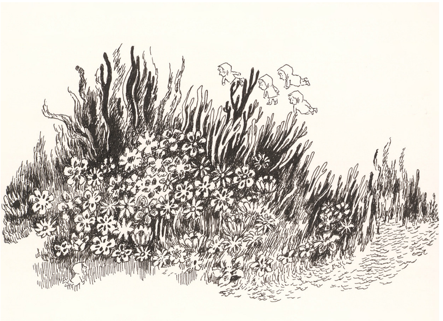
Encre de Chine sur papier - 8 x 13,5 cm

récit onirique. Dans cette nature si grande, les personnages de Nylso sont tout petits, tapés entre des traits dignes des illustrations qui ornent les livres de Jules Verne. Organiques, minéraux ou végétaux, les paysages de Nylso bruissent sous la pointe de son Rotring. Lumière naturaliste et zones d'ombres rythmiques rendent le paysage fragile mais le dessin puissant. L'accumulation de fines hachures fait vibrer le dessin qui semble en proie au vent, au souffle ou au murmure des « Julys ». Le dessin, comme une empreinte digitale, se soumet à l'étroitesse d'une case ou se déploie pour former la masse ou le volume imposant d'un rocher. Chaque dessin de Nylso est une invitation à observer, à ouvrir l'oeil, et, dans cet ouvrage aux allures de vieux carnet, on se prend à rêver d'à notre tour rencontrer une July égarée.