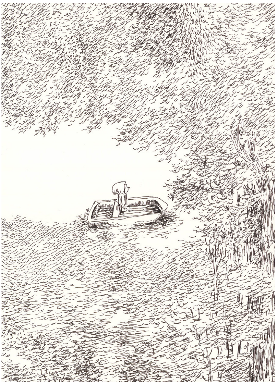
Encre de Chine sur papier - 20,3 x 13,7 cm