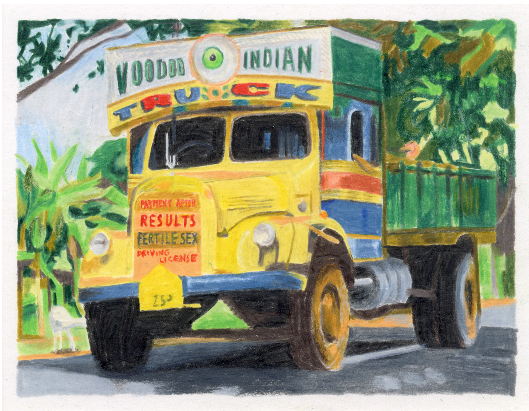
Stéphane DE GROEF - Voodoo Indian Truck -2015 - 9 x 12 cm - Crayons de couleur sur papier