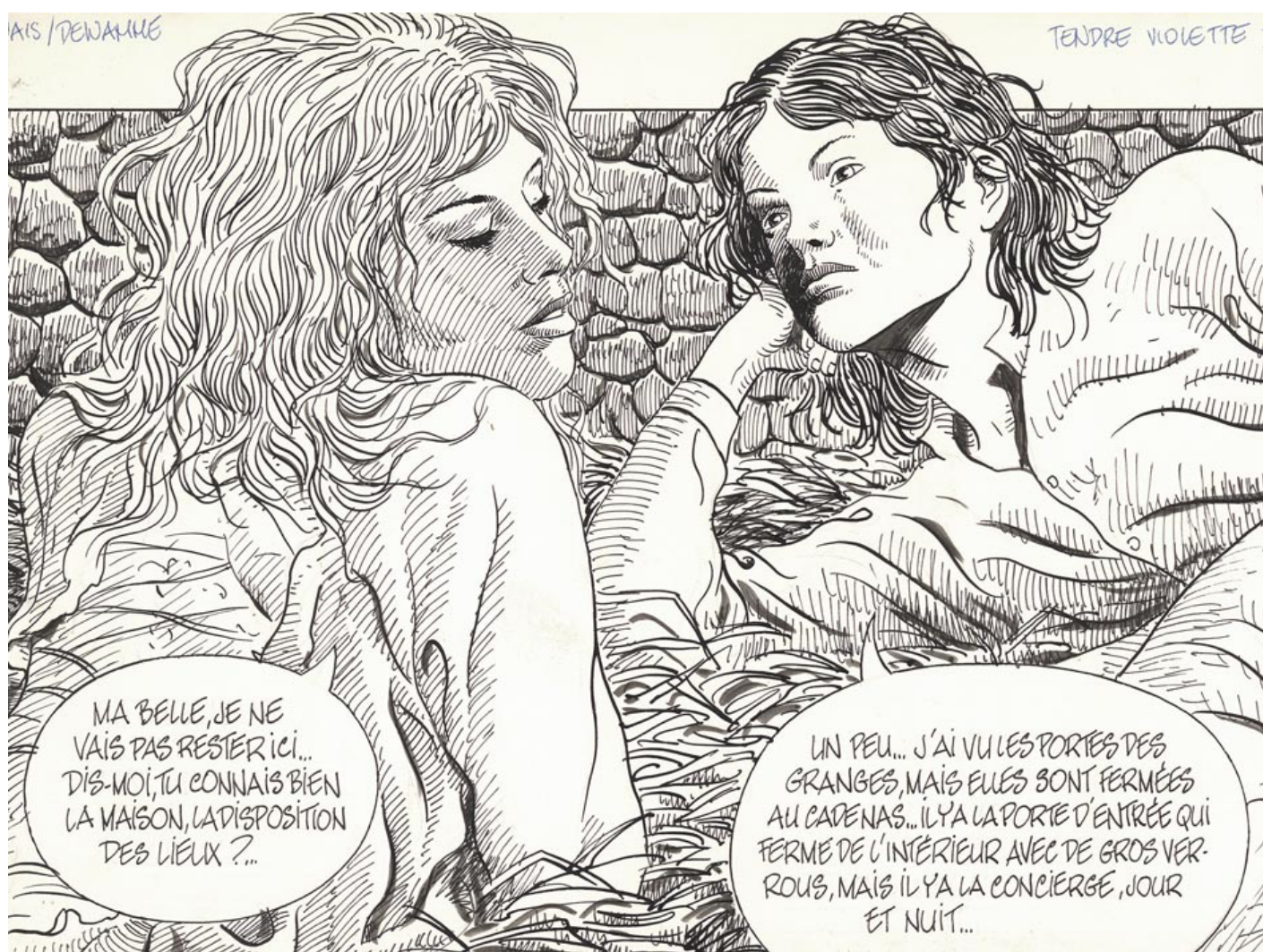
(Détail) Tendre Violette - Chapitre Any - 1982 - Planche 8 - Encre de Chine sur papier - 49 x 34,8 cm