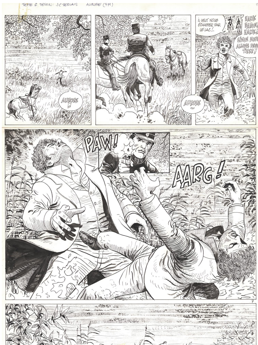
La Tchalette - Planche 7 - 1982 - Encre de Chine sur papier - 47 x 34,7 cm - Signé en bas à droite

Servais excelle dans l'art du clair-obscur — non seulement dans sa maîtrise graphique, mais aussi dans sa manière de révéler la part d'ombre qui habite les êtres. Ses personnages, souvent féminins, avancent entre vulnérabilité et puissance, entre désir de liberté et attachement profond aux lieux qui les ont façonnés. Qu'il s'empare de légendes populaires, d'événements historiques ou de drames intimes, le dessinateur restitue toujours la dimension humaine avec une exquise délicatesse.