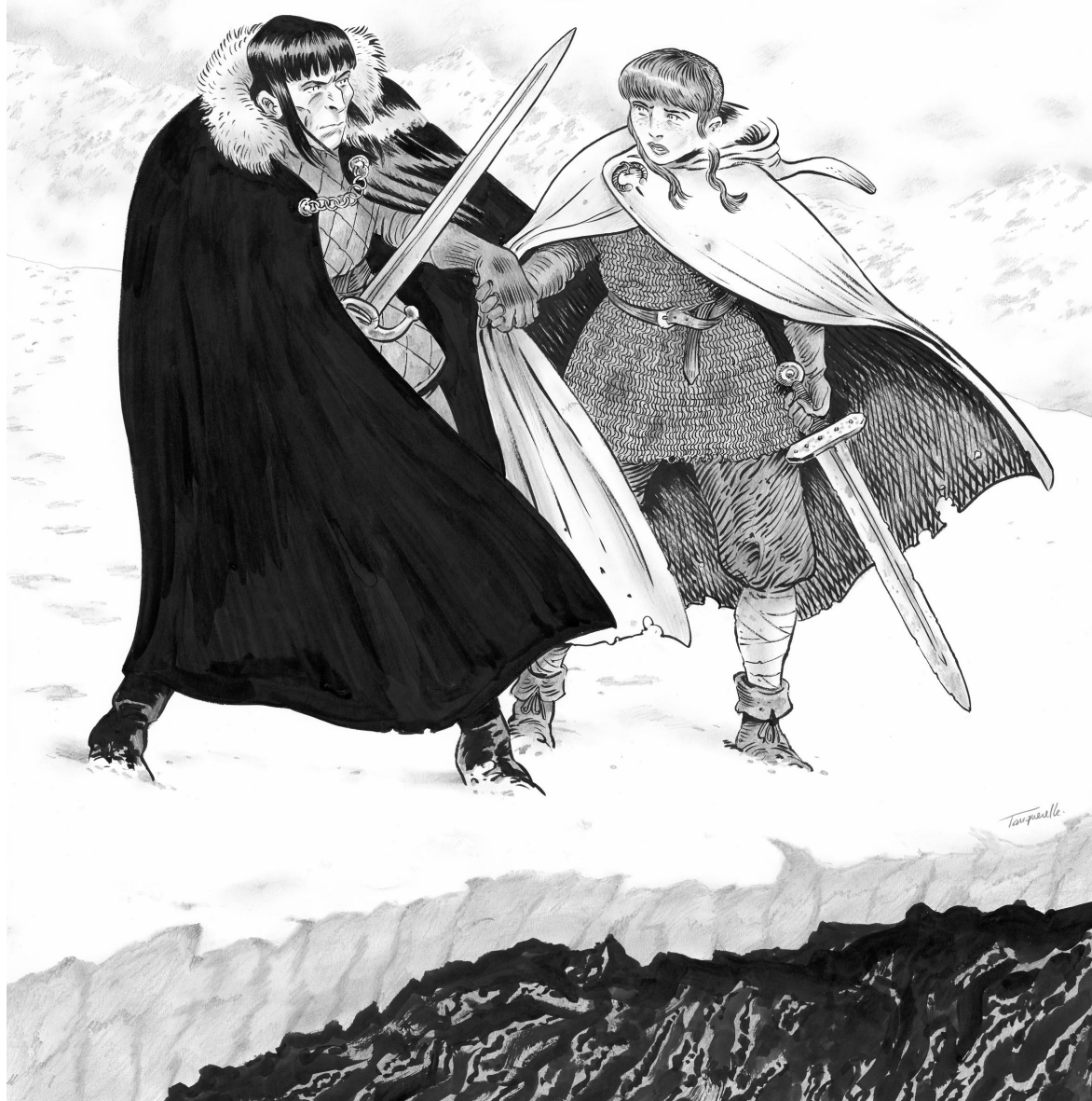
HERVÉ TANQUERELLE - La Terre verte - Encre de Chine, mine de plomb et gouache sur papier - 67,8 x 50 cm