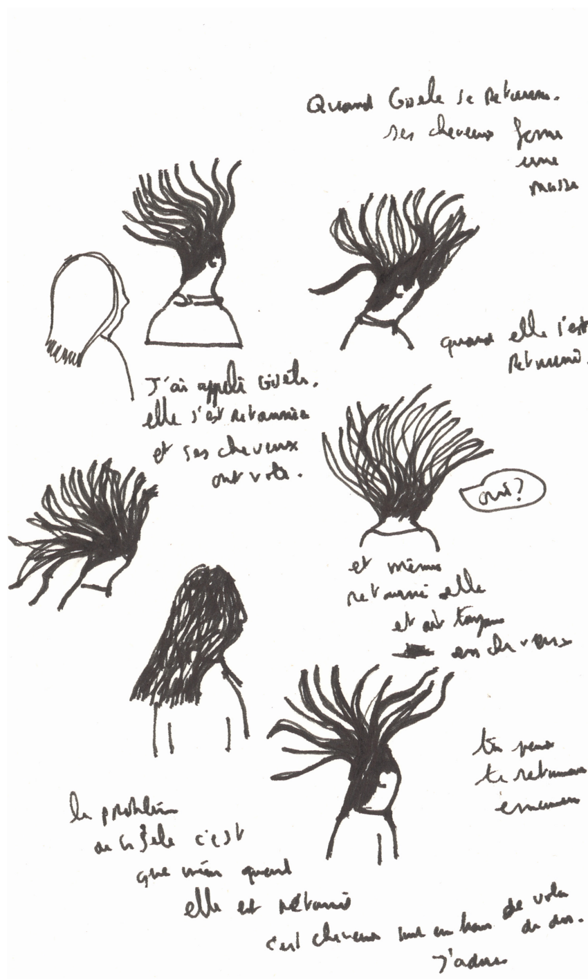
Le sens de la vie et ses petits - Recherche - 2024 - Encre de Chine sur papier - 14 x 9 cm - Signé au dos

La galerie Huberty & Breyné est heureuse d'accueillir Le sens de la vie , la première exposition d'Eric Veillé dans son espace Paris I Chapon-21, du 26 février au 28 mars 2026. À travers une sélection de planches originales (dans tous les sens du terme) et de dessins inédits, l'exposition nous invite à observer la finesse des traits de plume et d'esprit de l'artiste.