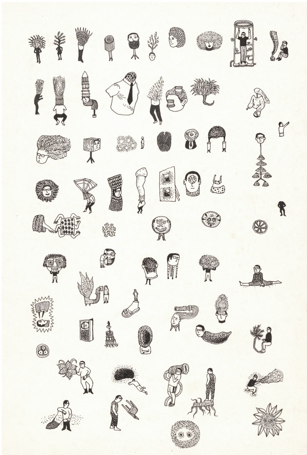
Le sens de la vie et ses frères - 2008 - Encre de Chine sur papier - 19,5 x 11,9 cm