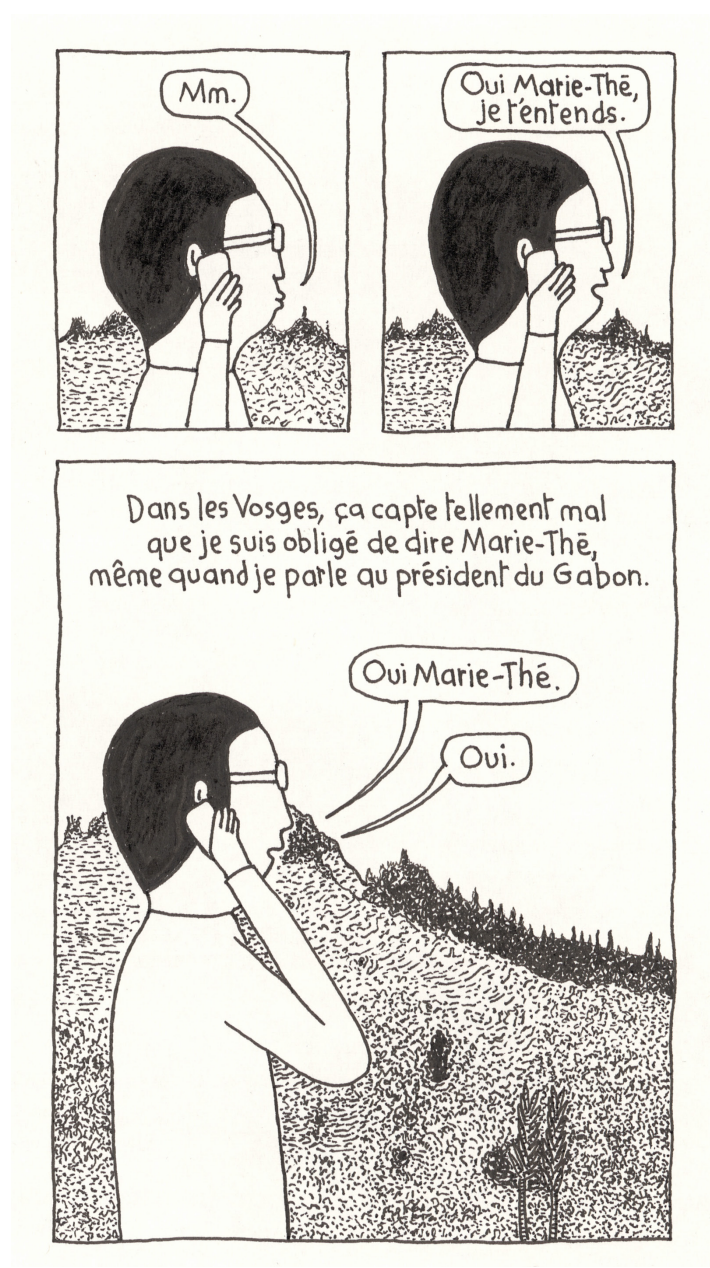
Le sens de la vie et ses petits - 2024 - Encre de Chine sur papier - 14 x 7,3 cm